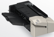
Finalizador interno: G1