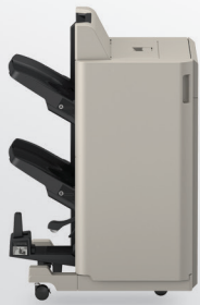
Finalizador de folletos: U1

Se muestra el modelo imageRUNNER ADVANCE C3330i