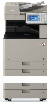
Unidad de alimentación por casete: AL1