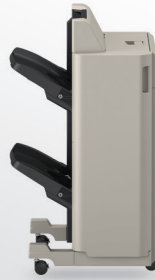
Finalizador engrapador: U1